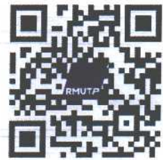
สแกนเพื่อสมัคร

สมัครได้จากหน้ารับสมัครการประกวดสุนทรพจน์ เนื่องในวันพ่อแห่งชาติ ๕ ธันวาคม ๒๕๖๓ ในเว็บไซต์กองศิลปวัฒนธรรม http://cul.offpre.rmutp.ac.th หรือ สแกน QR Code โดยกรอกแบบฟอร์มพร้อมแนบไฟล์ภาพบัตรประจำตัวประชาชนผู้สมัคร (ผู้สมัครต้องแสดงบัตรประจำตัวประชาชน ณ จุดลงทะเบียนในวันประกวดด้วย) หรือ สมัครด้วยตนเอง ณ กองศิลปวัฒนธรรม ชั้น ๕ อาคารสำนักงานอธิการบดี มหาวิทยาลัยเทคโนโลยีราชมงคลพระนคร ศูนย์เทเวศร์ ภายในวันที่ ๒๕ พฤศจิกายน ๒๕๖๓