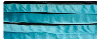
สีเขียวไข่มุก