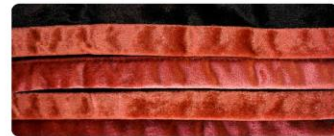
สีแดงตัด