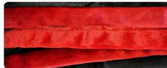
สีแดงชาด