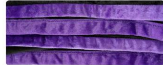
สีดอกอัญชัญ