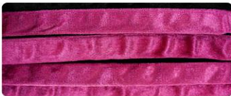
สีดอกบานเย็น