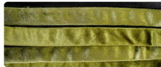
สีเขียวมะกอก