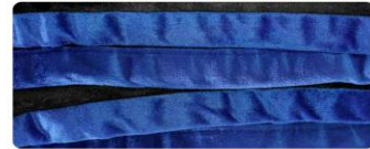
สีครามฝรั่ง