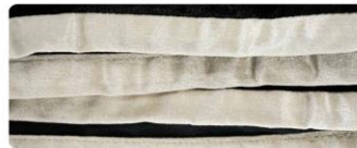
สีงาช้าง