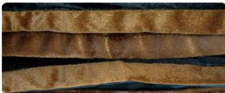
สีน้ำตาล